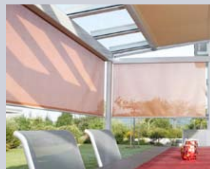
Toldo vertical VertiTEx