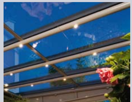
Luces halógenas Lux Design