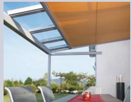
Toldo inferior Sottezza